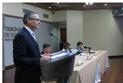
Discurso del Canciller Manuel A. González en el TSE

El jueves 8 de diciembre se llevó a cabo en el auditorio del Tribunal Supremo de Elecciones (TSE), la presentación del estudio titulado “ El enfoque de las brechas estructurales: el caso de Costa Rica ”, el cual fue elaborado por la institucionalidad costarricense, con el apoyo de la Comisión Económica para América Latina (CEPAL).