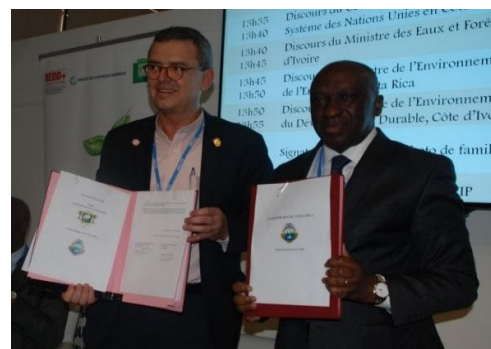
Ministros de Ambiente de Costa Rica y Côte d'Ivoire

El Acuerdo permitirá desarrollar la cooperación sur-sur entre ambas naciones, en el tema de cambio climático y bosques, con el fin también de reforzar y acelerar las estrategias derivadas de nuestro Plan Nacional de Desarrollo Forestal y el Programa de Bosques y Desarrollo Rural que, entre otros, incluye la Estrategia Nacional de Reducción de Emisiones por Deforestación y Degradación de Bosques, más conocida como REDD+, así como la Estrategia de Manejo Integrado de Paisajes Productivos e Inclusivos, que implementa la agenda agroambiental.