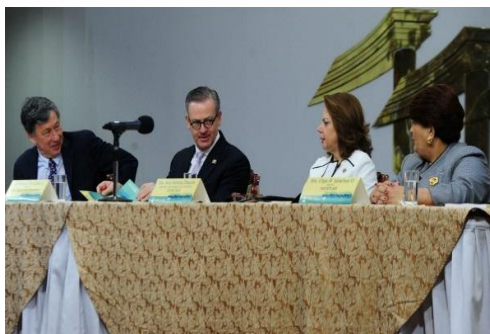
Mesa principal durante la presentación del estudio

Durante la actividad, el Canciller Manuel González, manifestó que, “como lo demuestra el enfoque presentado, a pesar de los avances, Costa Rica, al igual que otros países de renta media, tiene enormes obstáculos al desarrollo y, precisamente este estudio, pone en evidencia que la comprensión correcta del desarrollo sostenible no puede equiparse al indicador de ingreso per cápita, excluyéndonos sistemáticamente del acceso a la cooperación internacional”.