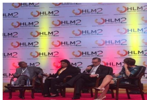
Canciller González en panel de países de renta media

El Canciller informó sobre los resultados del Enfoque Nacional de Brechas Estructurales, impulsado por la Dirección de Cooperación Internacional de la Cancillería (DCI) y realizado conjuntamente por las instituciones nacionales y la CEPAL, mediante el cual, se identificaron y priorizaron seis brechas para el caso de Costa Rica: educación, género, pobreza y desigualdad, infraestructura, productividad e innovación y fiscalidad; todas ellas alineadas con los ODS.