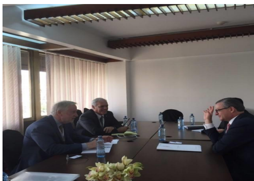
Encuentro bilateral durante la Reunión de Alto Nivel

responsabilidad social empresarial y las organizaciones sociales, en la inclusión de los jóvenes y en el avance en las asociaciones público - privadas para desarrollar nuestra infraestructura. Como parte de las acciones concretas del Gobierno en este campo, el pasado 9 de setiembre Costa Rica fue uno de los primeros países en firmar un “Pacto Nacional para la Consecución de los ODS”, que fue respaldado por el Poder Ejecutivo, el Poder Legislativo, Poder Judicial, así como por representantes de gobiernos locales, sector privado, organizaciones sociales y religiosas, academia, entre otros grupos.