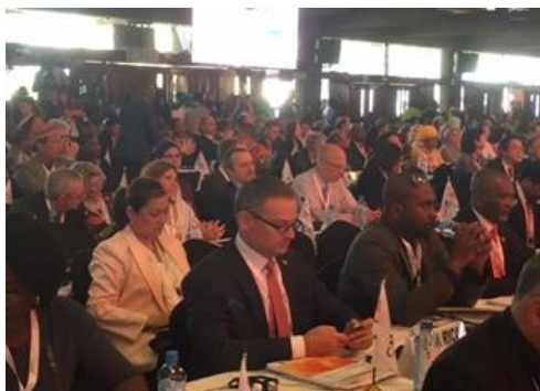
Delegación de Costa Rica en la Reunión de la AGCED

clasificación obsoleta que no reconoce las complejidades y los desafíos de desarrollo de este grupo de países y que además, invisibiliza sus vulnerabilidades y las brechas estructurales que enfrentan a pesar de haber realizado esfuerzos importantes para alcanzar niveles adecuados de bienestar y desarrollo para sus poblaciones.