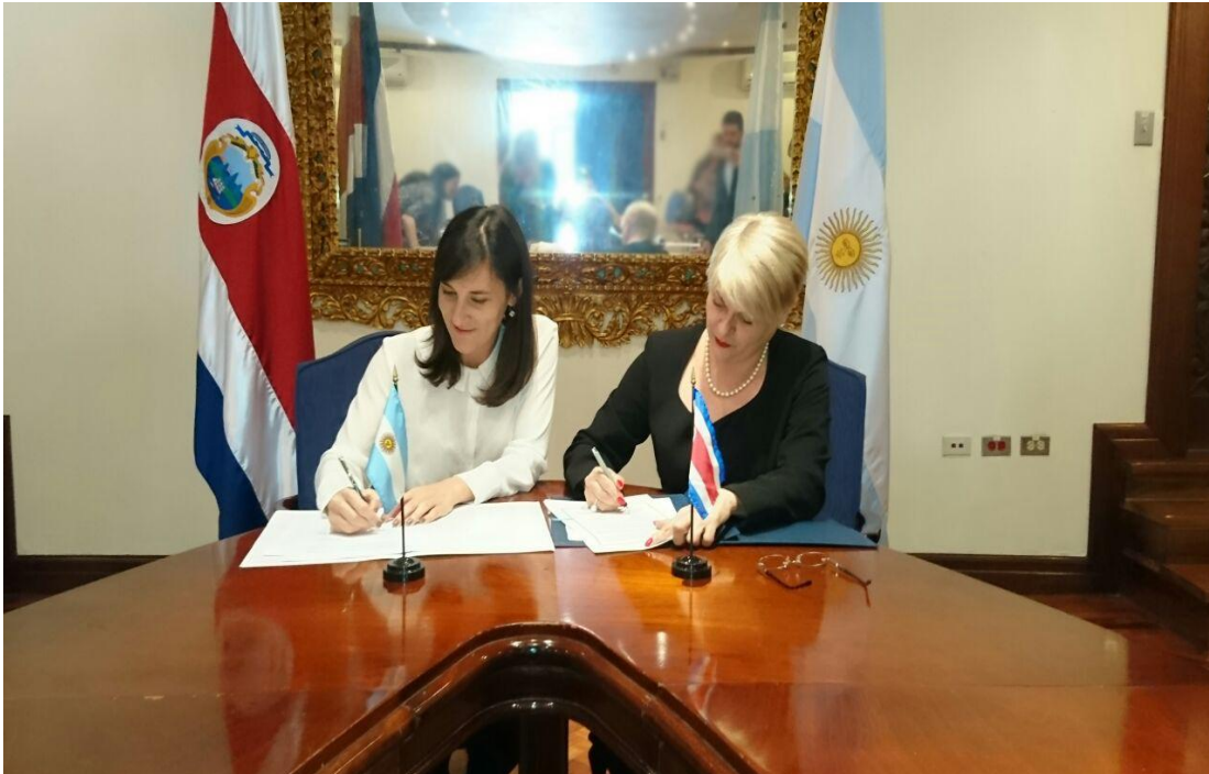
Firma del Acta de la III Comisión Mixta de Cooperación Costa Rica – Argentina en el Salón Azul de la Cancillería

En el marco del Convenio de Cooperación Científica y Técnica existente entre el Gobierno de la República de Costa Rica y el Gobierno de la República Argentina, se realizó el 22 de noviembre la III Reunión de Comisión Mixta de Cooperación Científica y Técnica Costa Rica-Argentina.