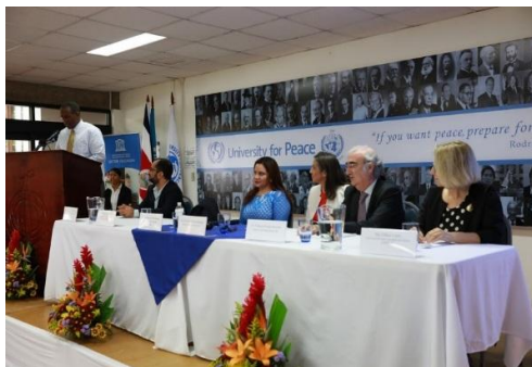
Acto de apertura del Taller sobre áreas STEAM

integren el enfoque de igualdad de género como medio para incentivar el interés y la creatividad de niñas jóvenes e impulsarlas a considerar opciones educativas y laborales en esos campos.