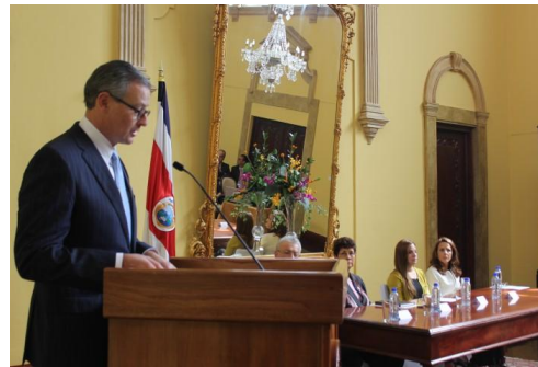
Acto de Presentación de la iniciativa en la Cancillería

El 4 de noviembre el Canciller Manuel A. González Sanz presentó la iniciativa del Ministerio de Relaciones Exteriores y Culto de obtener 200 becas, de pregrado y posgrado, con total cobertura y en áreas académicas de interés para el país, que lleva por nombre “SOMOS 2021”.