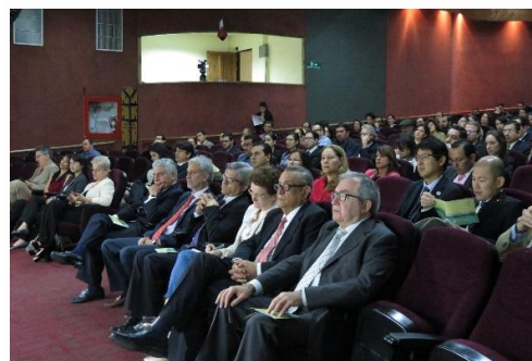
Asistentes al acto de lanzamiento en el TSE

Cancillería (DCI) en el 2013 a la CEPAL y su operativización con las instituciones nacionales fue coordinada por MIDEPLAN y la DCI. El estudio ha tenido como uno de sus fines últimos, permitir una argumentación adicional a nuestras embajadas, en la gestión de la cooperación internacional.