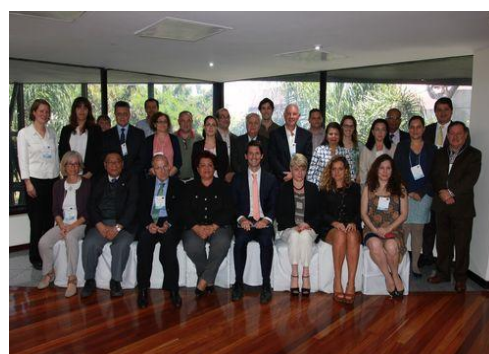
Participantes en la reunión de EU-LAC Health

salud (I+D+I) entre Europa, América Latina y el Caribe. Actualmente, se enmarca en la relación birregional y el proceso de diálogos y Cumbres CELAC-UE, manteniendo como propósito primordial el desarrollar de forma conjunta la investigación y la innovación en el área de la salud, aprovechando las capacidades y experiencias de los países miembros de ambas organizaciones. Todo ello, con el fin último de beneficiar e impactar a un amplio número de personas, en especial a quienes conforman los sectores más vulnerables de sus sociedades