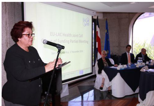
Acto inaugural de la reunión de EU-LAC Health

El 17 y 18 de noviembre se llevó a cabo en San José una reunión de los socios y las agencias de financiamiento europeas y latinoamericanas, del programa birregional EU-LAC Health, con el fin principal de discutir y finalizar la primera convocatoria de proyectos de investigación e innovación en salud, gestionada por el programa en el marco de la Iniciativa Conjunta para la Investigación e Innovación en Salud (JIRI-Health por sus siglas en inglés).