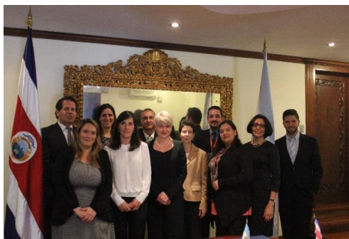
Participantes en la III Comisión Mixta de Cooperación

Se señaló la importancia de lograr que el nuevo listado de proyectos sea una herramienta, para fortalecer cada uno de los sectores estratégicos identificados para el próximo bienio en los planes nacionales de desarrollo; lo que permitirá transitar hacia una cooperación horizontal, caracterizada por el intercambio de conocimientos y capacidades institucionales.